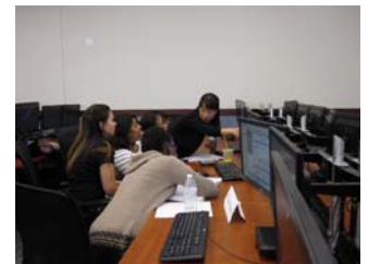
コンピューターゲーム