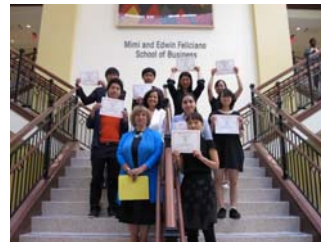
2015年:経営ゲーム終了式(アメリカ)